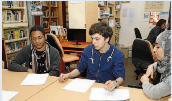
Durant la xerrada es van discutir diferents qüestions sobre la Constitució de 1978.

tots coincideixen en què «la independència de Catalunya afectaria». Uns opinen que «Catalunya no seria viable per si mateixa», i d'altres que «la resta del país se'n ressentiria».